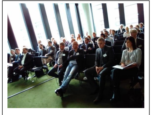
Teilnehmer des ersten MARSAT Workshops Sept. 2017. Teilnehmer von Behörden und Wirtschaft nutzten die Gelegenheit zu intensiven Diskussionen rund um das Thema „Earth Observation for the Maritime Industry“

Das Anwendungspotenzial von neuartigen Fernerkundungsdiensten in der maritimen Wirtschaft wird als sehr hoch eingeschätzt. Der wachsende Bedarf an räumlichen Informationen, Daten und Dienstleistungen in diesem Bereich ist in verschiedenen Nutzergruppen deutlich erkennbar.