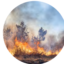
Erfassung von Vegetationsbränden

Auf unserer Webseite finden Sie aktuelle Projekte und Anwendungsbeispiele.