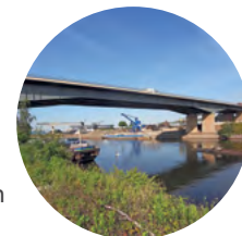
Erfassung von Höhenänderungen