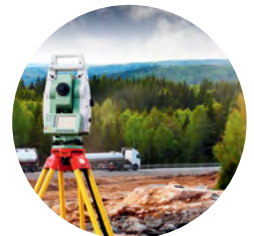
Vermessung von Verkehrswegen