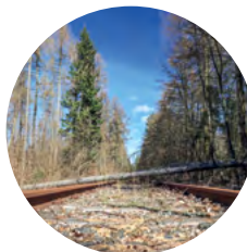
Ableitung von Baumbeständen